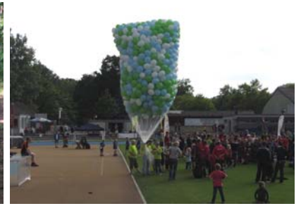
Schlussfeier Jugend, 4000 Ballone symbolisch für jeden Teilnehmer