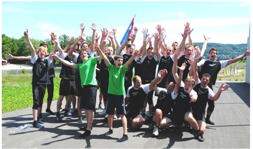
Die Aktivriege in bester Turnfeststimmung

Nach einer nächsten Lektion bei unserem Pa-parazzi und seiner „Pocket-Sternwarte“ liessen wir die Zeit für uns arbeiten und genossen den Nachmittag an der Bar, am Festbank und in der Arena in nächster Nähe am geschehen unserer Damen...;-) Da nicht alle den ganzen Nachmittag verarbeiten konnten, gab es bei einigen ein kleines Power-Nap, bei anderen wiederum sehr runde Fusssohlen...;-) Die Nacht krachte in der kleinsten Bar auf dem Festgelände und hie und da hörte man eine Stimme eines kleinen Weichtiers rufen: Sch'geil, geil, geil. So wurde es langsam morgen, bis es nur noch Freaks stehend hatte und jeder suchte sich eine Nische für zwei, drei Stündchen. Am prächtigen SONNtag dann schauten wir alle mit gespannten Augen den Schlussvorführungen und Mege's Fahnen-