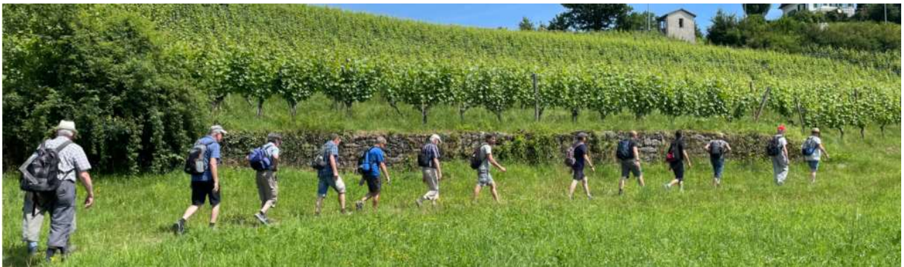
durch die Weinberge Oetwil